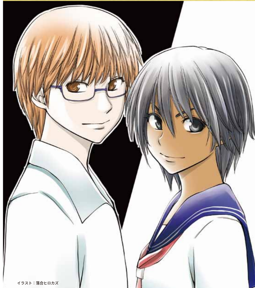
イラスト：落合ヒロカズ