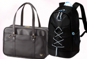
OLIVE des OLIVE School